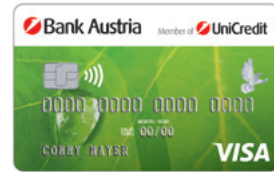
Raindrop P3 aus Bio-Material