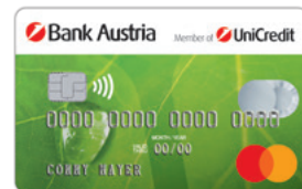
Raindrop P6 aus Bio-Material

Die Bestätigung über die Zulassung zum Studium werde ich an card complete innerhalb eines Jahres nach Ausstellung der Karte bzw. auf Aufforderung übermitteln. Dieses Angebot gilt für ordentliche Studierende an Universitäten, Akademien und Fachhochschulen ab dem vollendeten 18. bis zum vollendeten 30. Lebensjahr sowie für MaturantInnen im Maturajahr.